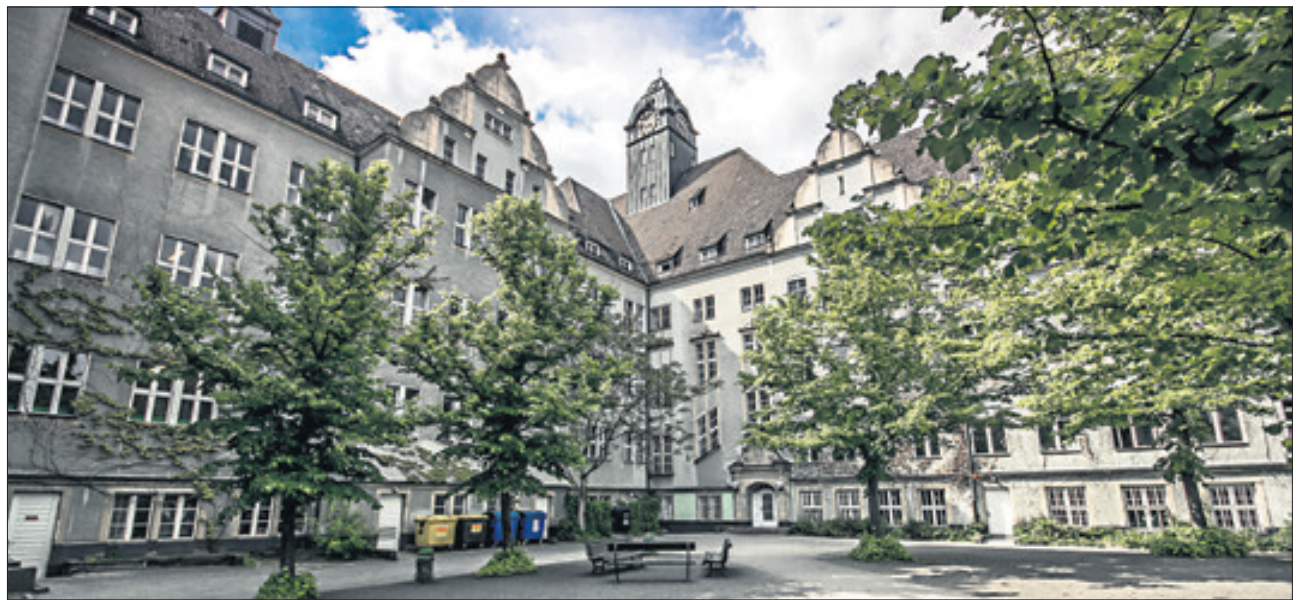
Innovationen werden am Humboldt-Gymnasium im Ortsteil Tegel groß geschrieben.

Wittenau – Das Romain-Rolland-Gymnasium bietet am Samstag, dem 16. Januar, um 9.00 Uhr im Restaurant scolaire (Cité Foch, Place Molière 4) eine Informationsveranstaltung für Eltern und ihre Kinder zum Übergang in die 7. Klasse an. Im Anschluss daran kann die Schule besichtigt werden, die dann die Ergebnisse der Projekttag präsentiert. Aufgenommen werden Schüler mit einer Empfehlung für das Gymnasium, die als erste Fremdsprache Englisch oder Französisch lernen; die andere Sprache wird dann als zweite Fremdsprache begonnen. Als dritte Fremdsprache werden ab Klasse 8 Spanisch, Latein und Chinesisch angeboten. Schüler mit Englisch als erster Fremdsprache können sich auch für den naturwissenschaftlichen Zug anmelden. Nähere Auskünfte erteilt das Sekretariat unter Tel. (030) 414 01 70.