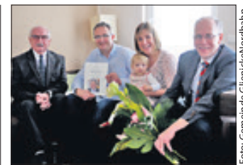
Helenes Eltern freuen sich über die Ehrenurkunde.

sind standfest, aber leicht, mal spielerisch und verspielt – wie von tanzenden Händen gemacht“, beschreibt sie ihre Werke, die im eigenen Keramikofen gebrannt werden. Künstlerische Gestaltung ist ihr dabei ebenso wichtig wie die Gebrauchsfähigkeit der hergestellten Arbeiten. Oft mischt sie verschiedene Tonarten und -farben miteinander und staunt dann darüber, „was mir die gemischten Tonarten für die Formgebung bereithalten“, sagt sie. „So suche ich eben nicht das perfekte Ergebnis, sondern Zufälligkeiten sind durchaus erwünscht und geschätzt. Die Ausstellung ist noch bis Mitte März jeweils freitags und sonntags von 14 bis 18 und sonntags von 13 bis 18 Uhr zu sehen. kal