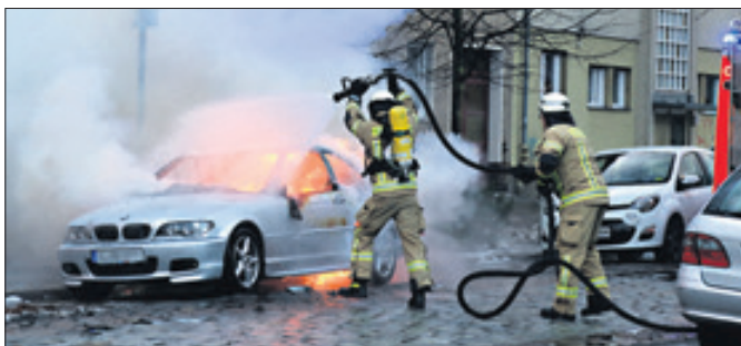
Die Feuerwehr löschte das Fahrzeug nach zehn Minuten.

BMW in der Tegeler Treskowstraße brannte komplett aus