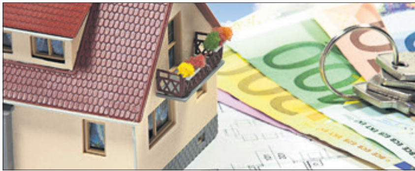
Mit den richtigen Tricks lässt sich einfach Energie und Geld sparen.

Bauen und Wohnen in Reinickendorf und Umgebung – das ändert sich in 2016