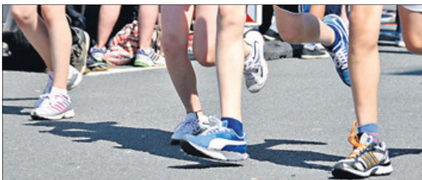
Der SC Tegeler Forst startet mit Unterstützung in die Laufsaison.

SC Tegeler Forst verstärkt seinen Mittelstreckenbereich