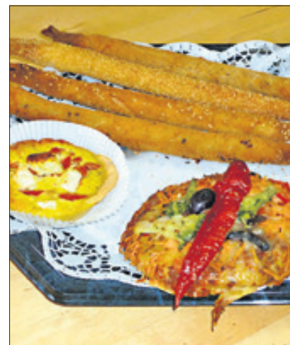
Die fleischlosen Snacks treffen den Geist der Zeit.

Nach mittlerweile gut einem Jahr in Reinickendorf fühlt man sich wohl im Bezirk. Die knapp 700 Quadratmeter großen Räumlichkeiten in den GSG-Gewerbehöfen an der Saalmanstraße, direkt hinter dem S-Bahnhof Karl-Bonhoeffer-Nervenklinik, sind zu einer neuen, mit modernem Equipment ausgestatteten Werkstätte für die insgesamt 14 Mitarbeiter avanciert. Sie stellen täglich bis zu 3.000 Stück der vegetarischen Kost her. Zu den weiteren Zielen befragt äußert sich der Inhaber wie folgt: „Wir wollen uns am Standort etablieren, uns stabilisieren, die Qualität hochhalten sowie bei Bedarf neue Produkte entwickeln“. Gegen neue Kunden hat er ebenfalls nichts einzuwenden, hofft auf Mundpropaganda zufriedener Knuspersnacker. ks