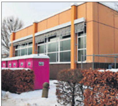
Beschlagnahmt: die Turnhalle der Emil-Fischer-Schule in der Cycloppstraße.

Turnhallen von fünf Reinickendorfer Schulen dienen inzwischen als vorübergehende Flüchtlingsunterkünfte