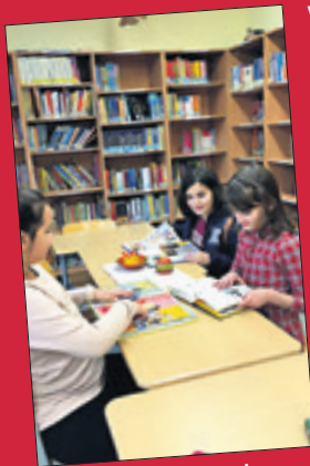
Wir stöbern gern in den Büchern unserer Schulbibliothek.

Hellena: Als Schülerversammlung kann ich auch gut bei der Schulgestaltung mitwirken. Mir gefällt es, meine Mitschüler vertreten zu dürfen und eine Ansprechpartnerin für Lehrer, Eltern und Schüler zu sein.