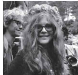
Kinofilm Janis: Little Girl Blue, Doku (engl. OmU) von Amy Berg über Janis Joplin, City Kino Wedding, 21:15 Uhr, Karte 6 €