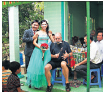
Musikalische Unterstützung bei einer Hochzeit in Vietnam.

Heiligensee – Hans Neumann ist ein umtriebiger Mensch. Auch wenn der gebürtige Reinickendorfer gern in seinem Ortsteil Heiligensee lebt, so zieht es ihn doch Jahr für Jahr aufs Neue in die Ferne. 83 Länder hat er in den letzten 45 Jahren bereist. Die Besonderheit dabei: „Henne“, wie er mit Spitznamen gerufen wird, entdeckt sie gern mit dem Fahrrad. Fragt man ihn nach der Anzahl seiner Reisen, so gerät er ins Grübeln. „300 mindestens, vielleicht sogar 350“, so seine Antwort.