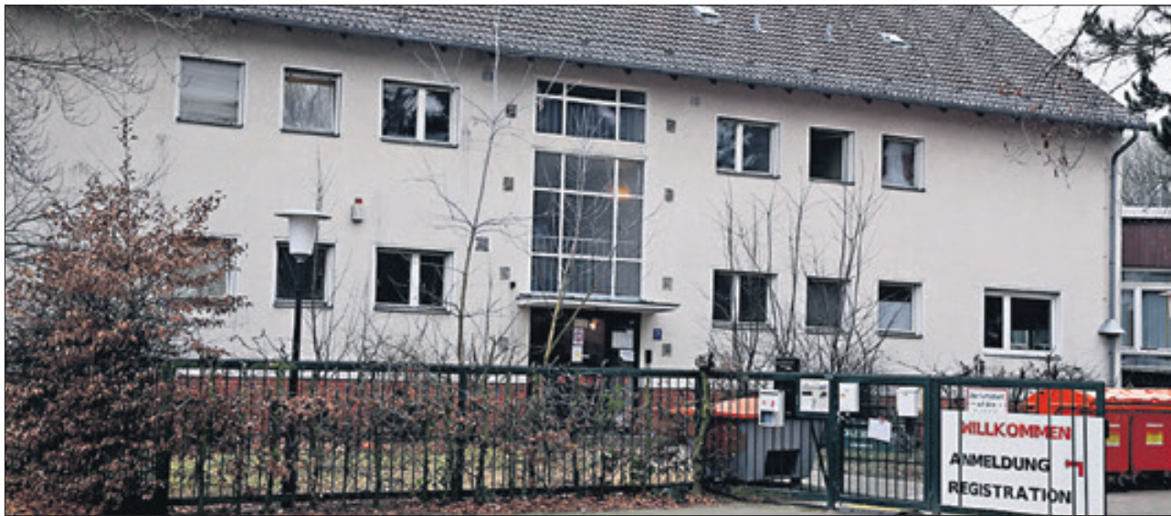
Noch wird das Collège Voltaire als Flüchtlingsunterkunft genutzt. Doch ab 1. Juni will hier die Montessorischule einziehen.