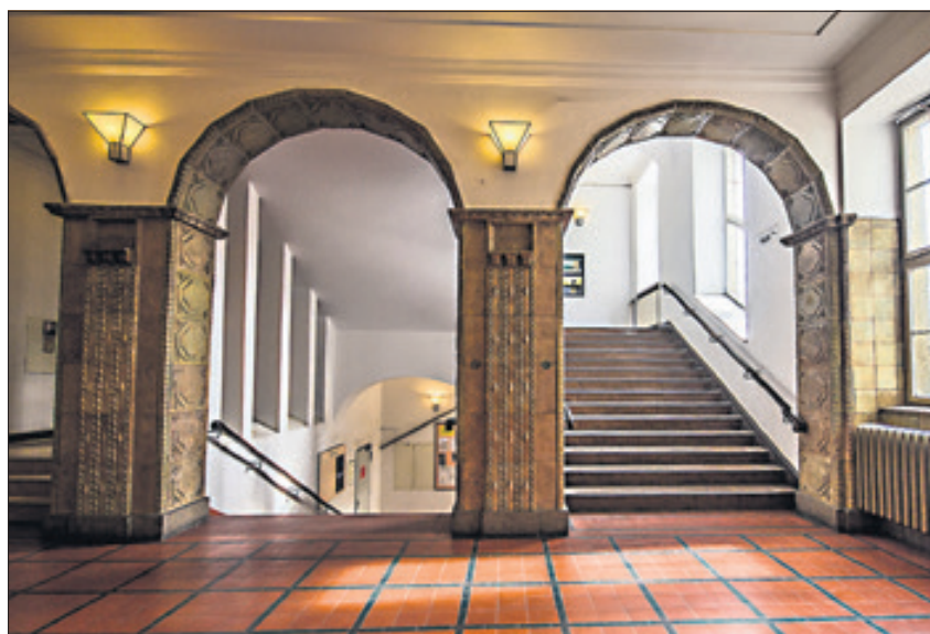
Neue Wege des Lernens im historischen Gebäude.

Das Humboldt-Gymnasium lädt am Samstag, den 16. Januar 2016 von 11 Uhr bis 15 Uhr zum Tag der offenen Tür ein.