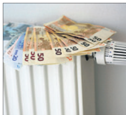
Durch energieeffizientes Bauen will der Bezirk u.a. Heizkosten sparen.

So wurde eine Vielzahl von Maßnahmen im Rahmen der baulichen Unterhaltung, durch Sonderprogramme und bei Neubaumaßnahmen in den bezirklichen Liegenschaften durchgeführt. Unter anderem wurden die Sporthallen der Borsigwalder Grundschule, der Max-Beckmann-Schule sowie der Fließtal-Grundschule saniert;