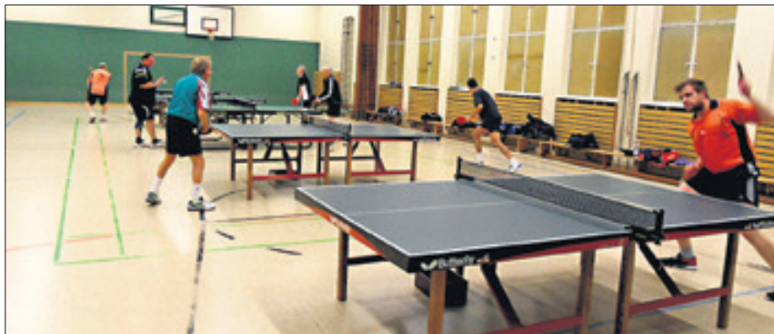
Vereinsmitglieder des Tischtennisclubs Lübars beim Training.