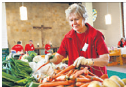
Sechs Ausgabestellen werden von Laib und Seele im Bezirk betrieben.

Lebensmittel für bedürftige Reinickendorfer zum ganz kleinen Preis