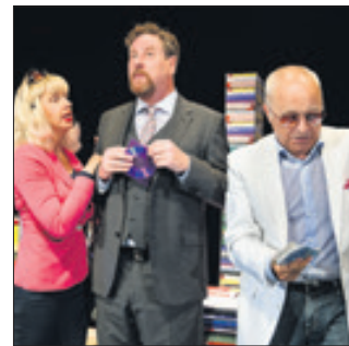
Kabarett Gastspiel der DISTEL mit „Klare Ansage: Total versteuert, Deutschland in der Steuerfalle“, Ernst-Reuter-Saal, 15 Uhr, Karte 8 €, über die Senioren-Kulturinitiative