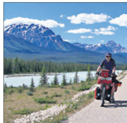
Mit dem Drahtesel auf Abenteuerreise durch Kanada.

Reisen ist die Ausrüstung. Rund 30 Kilogramm Gepäck hat der Individualreisende in der Regel bei sich, in kalten Gefilden schon mal etwas mehr. Passende Kleidung und Medikamente für den Notfall sind eine Selbstverständlichkeit. Das Essen bereitet er