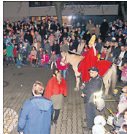
Spendenaktion bei den St. Martins-Feierlichkeiten.

Reinickendorf – Der Pastoralverbund Reinickendorf-Nord hat eine Sammelaktion für Flüchtlinge organisiert. Anlass für die Aktion waren die aktuelle Flüchtlingskrise und die Einrichtung der Notunterkunft in der Cité Foch. Beteiligt waren die Gemeinden St. Hildegard, Maria Gnaden und St. Martin, in denen während der Sankt Martinsfeiern und in den Gottesdiensten ehrenamtliche Helfer Geld sammelten. Die Spende in Höhe von 2.350 Euro kam bereits am 26. November letzten Jahres der Notunterkunft zu Gute, in der ungefähr 350 Menschen leben. „Gerade an aktuellen Feiertagen wie Sankt Martin sollte das Teilen nicht nur erzählt, sondern auch aktiv vollzogen werden“, so der Pfarrgemeinderatsvorsitzende Martin Figur. red