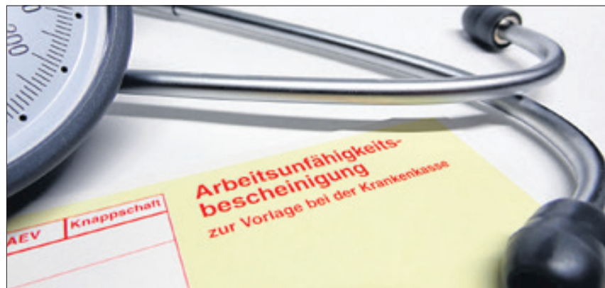
Reinickendorf hat den höchsten Krankenstand in Berlin.

Der Bericht zeigt zudem, dass die psychischen Erkrankungen zunehmen. Gemeint sind Depressionen, Anpassungsstörungen und Angststörungen. Auch in Reinickendorf treten sie im berlinweiten Vergleich überdurchschnittlich auf. Der Anstieg der psychischen Erkrankungen ist dramatisch, weil sie die häufigsten Ursachen für die Rente aufgrund von Erwerbsunfähigkeit ist – die so genannte EU-Rente. Die Zahlen der Studie beruhen auf anonymen Daten der Krankenkassen. as