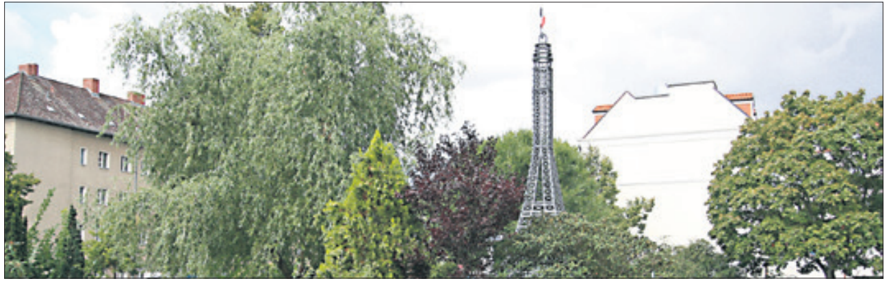
Der kleine Bruder des Eiffelturms von Paris vorm Centre Français in Berlin.

Hemmy Garcia · Welfenallee 6 · Frohnau Tel.: 030-40 10 77 74 www.hemmys.de