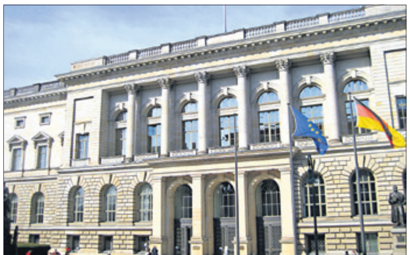
Am 18. September wird in Reinickendorf gewählt.

Berlin ist gleichzeitig ein Bundesland, eine Stadt und eine Gemeinde. Auf Landesebene wird aller Voraussicht nach Michael Müller oder Frank Henkel Oberbürgermeister werden. Auf Ebene der Gemeinde gibt es in Berlin Bezirke. Diese entsprechen den Gemeinden in anderen Bundesländern. Man spricht von Kommunalwahlen. In Berlin findet die Bezirkswahl immer am gleichen Tag wie die Landeswahl statt. Die Reinickendorfer werden am 18. September also auch die Bezirksverordnetenver-