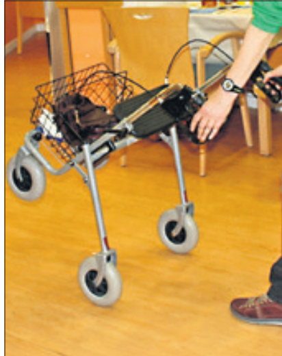
Zum Überwinden von Bordsteinen zieht man die beiden Bremsen an und kippt den Rollator nach oben.

Griffe sein. Damit ist sie ideal eingestellt, und die Grundvoraussetzung für eine sichere Handhabung geschaffen.