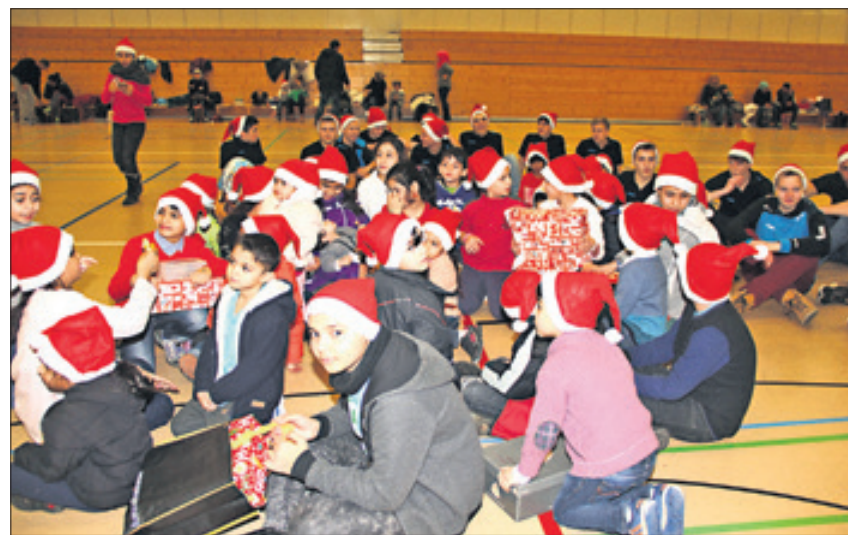
Leuchtende Kinderaugen in der Halle an der Place Molière.