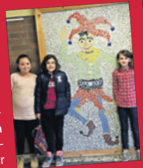
Die Mädchen vor einem Mosaik von Till Eulenspiegel.