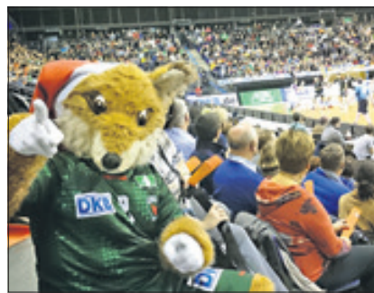
„Fuchsi“ drückt die Daumen.

Füchse-Spiel Danke für die 2 Karten, es war toll. Fuchsi sorgte für die Weihnachtsstimmung und gewonnen haben die Füchse auch mit 31:26. Toll dabei gewesen zu sein. Nochmals danke, Monika Lüer