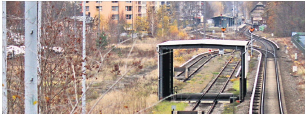
Der Regionalbahnhof, der auf der Strecke der Kremmener Bahn entstehen könnte, ist im Bundesverkehrswegeplan nicht vorgesehen.

Reinickendorf – Über 50 Prozent der tödlich verunglückten Fußgänger sterben nachts, obwohl das Verkehrsaufkommen wesentlich geringer ist. Besonders in der dunklen Jahreszeit müssen Fußgänger darauf achten, für die anderen Verkehrsteilnehmer sichtbar zu sein. Ein Autofahrer erkennt Menschen mit heller oder reflektierender Kleidung früher und kann schneller reagieren. Die Straße sollte nur an Ampeln oder gut beleuchteten Fußgängerüberwegen überquert werden. Bei Kindern können Reflektoren am Schulranzen die Sichtbarkeit bedeutend verbessern. Radfahrer sollten auch auf reflektierende Kleidung und eine vollständige Beleuchtungseinrichtung achten. Ein Helm kann im Falle eines Unfalls oft über Leben oder Tod entscheiden. Da die kalte oft auch die nasse Jahreszeit ist, sollten Autofahrer ihre Geschwindigkeit den Straßenverhältnissen anpassen und längere Bremswege einplanen.