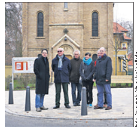
Große Freude bei allen Beteiligten.

Glienicke/Nordbahn – Sechs Wochen hat der Umbau des Vorplatzes der evangelischen Kirche in Glienicke/Nordbahn gedauert. Nun erstrahlt er in neuem Glanz. Die zum Teil sandfarbenen Pflastersteine heben zusammen mit dem Gotteshaus den dörflichen Charakter der Gemeinde hervor und es besteht endlich freie Sicht auf die denkmalgeschützte Kirche. Das Areal wurde auf 180 Quadratmeter vergrößert und der Bordstein abgesenkt, um insbesondere Menschen mit Gehbehinderung die Straßenüberquerung zu vereinfachen. Für den Umbau vor der denkmalgeschützten Kirche mussten die bestehenden Parkplätze entfernt und der zuvor breite Bereich der Gartenstraße verkleinert werden. Eine temporäre Zufahrt für Hochzeiten und Trauerfeiern ist dennoch dank beweglicher Poller möglich. red