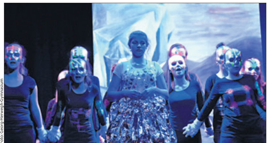
Die Schüler überzeugten mit ihrem selbstgeschriebenen und -komponierten Musical.