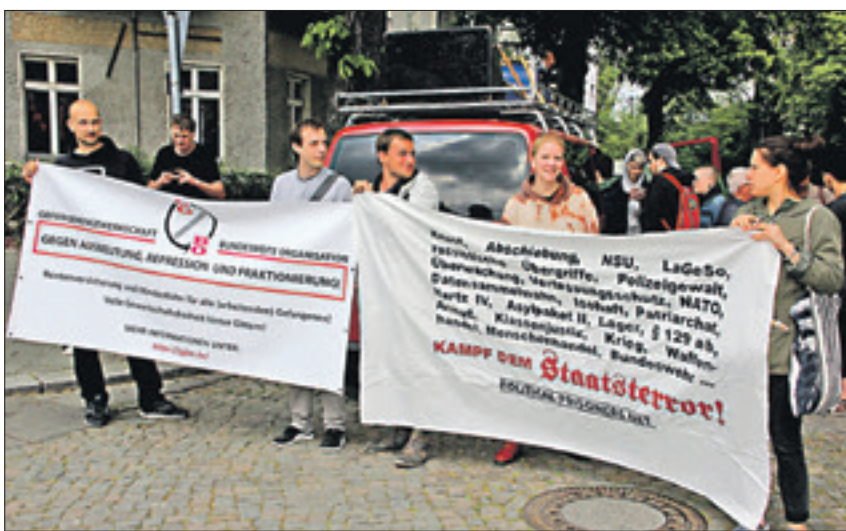
Überschaubar: Rund 30 Unterstützer hatten sich zur Kundgebung in der Dessinstraße gegenüber der JVA Tegel eingefunden.