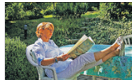
Mit der „Zeitvorsorge“ kann man entspannt in die Zukunft blicken.

Oftmals sind es nur Kleinigkeiten, bei denen ältere Menschen Hilfe benötigen: den Einkauf die Treppe hoch tragen oder den Fernseher programmieren. Vielen hilft es, wenn sie ab und zu mit jemand ein nettes Gespräch führen