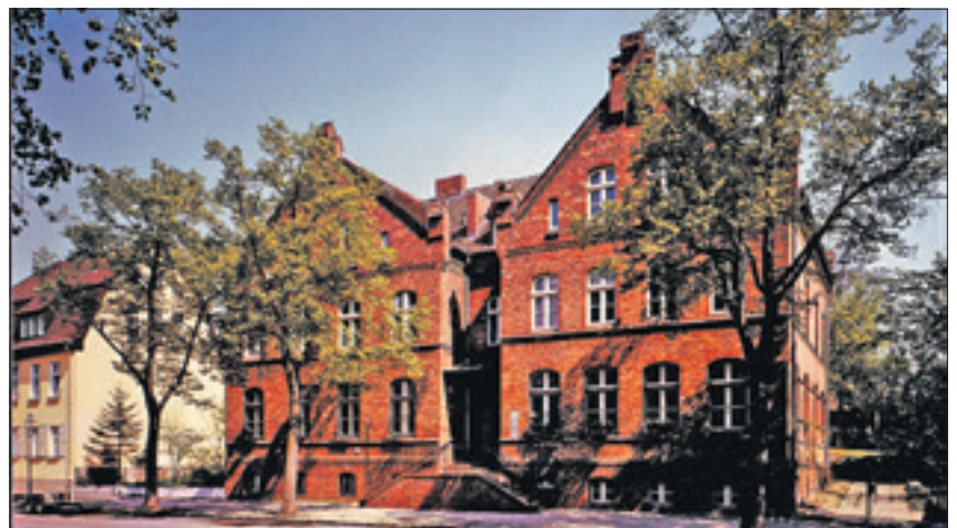
Eine Führung durch das Museum Reinickendorf gehört auch zur historischen Woche.