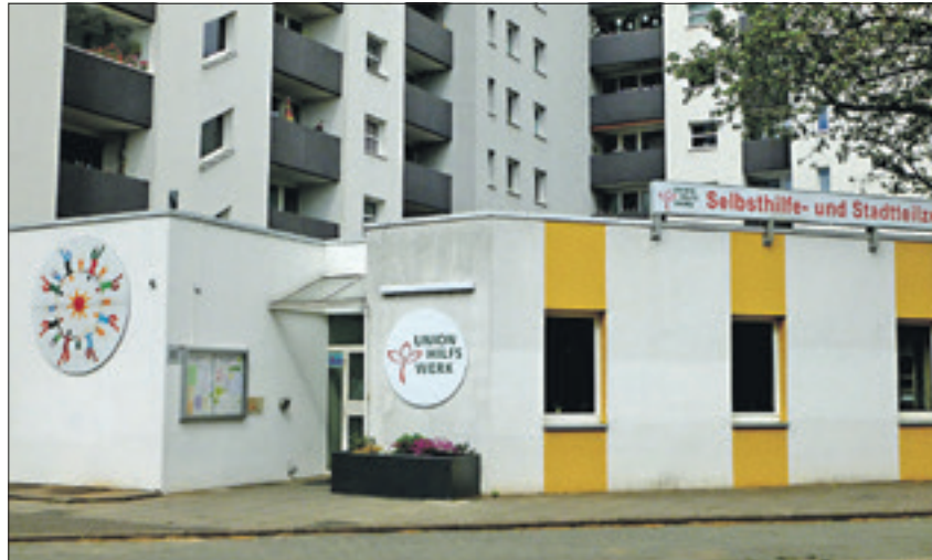
Die Begegnungsstätte umfasst 200 Quadratmeter und bietet drei Gruppenräume.

Begegnungsstätte bietet viel Raum für Gemeinsamkeiten