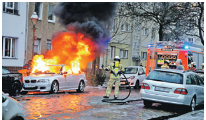
Bereits im letzten Jahr brannte ein Pkw in der Treskowstraße.

Es waren in diesem Jahr die ersten Brandstiftungen an Autos in Reinickendorf, teilte die Pressestelle der Polizei auf Anfrage der RAZ mit. Berlinweit habe es 111 solcher angezeigten Fälle bisher in den ersten fünf Monaten 2017 gegeben, dabei seien 119 Fahrzeuge in Mitleidenschaft gezogen worden.