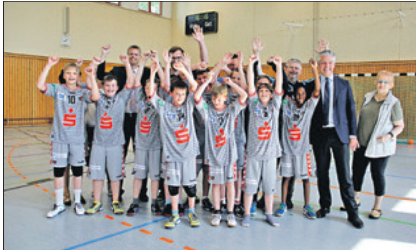
Verständlicher Jubel bei den D-Juoren der Fuchse. Sie haben ihre Halle wieder.

Halle der Mark-Twain-Grundschule wurde nach Sanierung am 30. Mai freigegeben