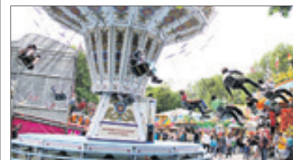
Kettenkarussells werden bei Berliner Volksfestsommer viele Mitfahrer finden.

Zudem kann man im Gourmetdorf typisch französische Spezialitäten bei Live-Musik und Bühnenprogramm genießen. Auch Familien kommen mit dem Kinderfest am 25. Juni, dem