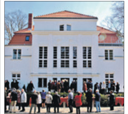
Kulturhaus Centre Bagatelle

Frohnau – Im Rahmen der Internationalen Gartenausstellung, die auch einen Standort in Frohnau hat, finden im Kulturhaus Centre Bagatelle, Zeltinger Straße 6, wieder mehrere Veranstaltungen statt. Am 15. Juni eröffnet um 19.30 Uhr die Ausstellung