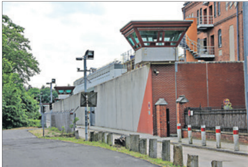
Hinter diesen Mauern passieren unschöne Dinge. Die Gefangenen-Gewerkschaft GG/BO fordert unter anderem die Schließung der Teilanstalt II in der JVA Tegel.

Dazu bekämen 18 Gefangene aus der Teilanstalt V, die eine Petition gegen die vollzugsbehördliche Tätigkeit des Sozialarbeiters R. unterzeichneten, die Repression der JVA Tegel deutlich