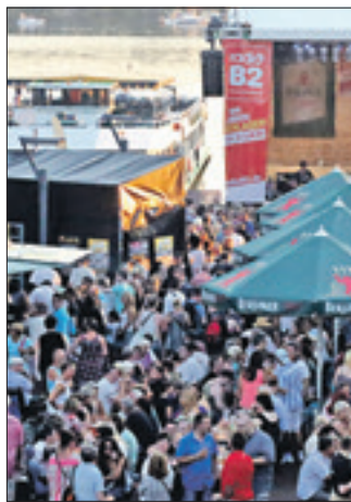
In den vergangenen Jahren war es an Wochenenden übervoll.

Auflagen: Schutzzäune für die Nachbarn, mehr Toiletten, Schallpegel-Reduzierung, Reinigungsverbot nach 22 beziehungsweise 24 Uhr, ein Kühlgeräte-Betriebsverbot in der Nacht, ein Polizei-abgestimmtes Sicherheitskonzept und eine Beschwerdestelle. Das ursprüngliche Konzept sei mit Rücksicht auf die Anwohner verändert worden