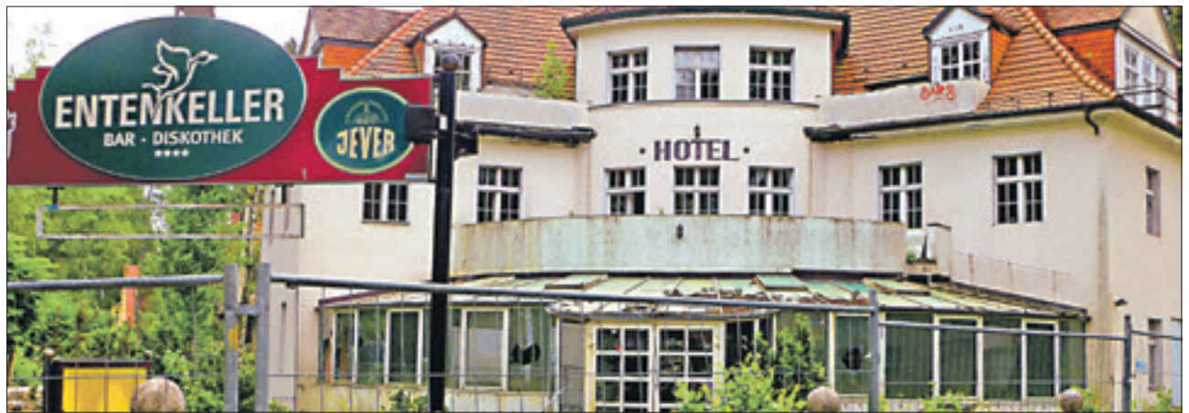
Der Entenkeller an der Oranienburger Chaussee macht alles anderes als einen schönen Eindruck.