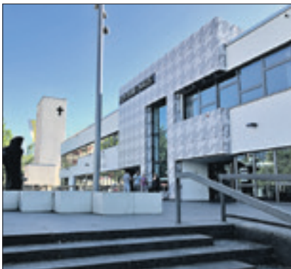
Der Veranstaltungsort der Messe

Noch bis zum 9. Juni können sich Unternehmen anmelden. Weitere Infos unter Tel. (030) 4150 8566 oder unter www.edu26.de red