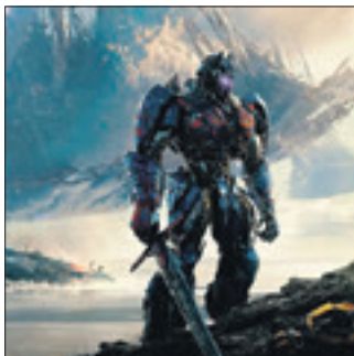
DIENSTAG, 27.06.2017 Kino TRANSFORMERS: The last Knight - mit Mark Wahlberg, Peter Cullen, Frank Welker und Gemma Chan, Bärlicher Autokino, 21:45 Uhr

Beratung Die sozialrechtliche Bertung für Geflüchtete findet jeden 4. Dienstag im Monat statt, Familienzentrums „Haus am See“, 15:30-18:30 Uhr, kostenfrei, Information und Anmeldung unter: 43722822