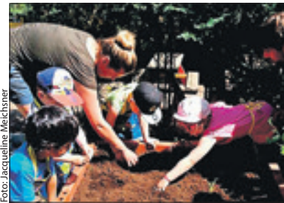
Die Kinder der Kita „Lustige Spatzen“ bepflanzen ihr Gemüsebeet.

Ziel dieser Aktion ist es, bereits Kindergarten-Kinder für eine gesunde und ausgewogene Ernährung zu begeistern. Wenn sie ihr eigenes Gemüse säen, pflanzen, ernten und gemeinsam essen, verändert das ihre Einstellung zu Lebensmitteln und verbessert vielleicht ihre Ernährungsgewohnheiten. Das Erleben von Natur mit allen Sinnen und der Umgang mit Erde, Wasser, Saatgut und Pflanzen ermöglicht den Kleinen außerdem eine intensive Erfahrung, die sie heutzutage viel zu selten machen. Das Projekt wurde von der Stiftung „Gemüsebeete für Kids“ unterstützt und vom edeka-Markt Görse & Meichsner als Pate begleitet.