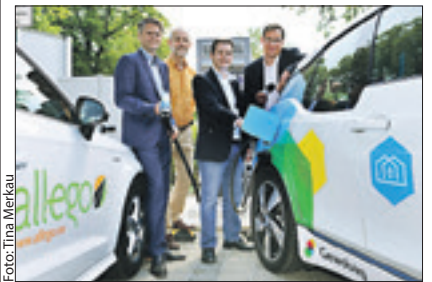
Eine Möglichkeit mehr: Künftig kann das Auto auch in Tegel aufgeladen werden.

Die Schnellladestation in der Berliner Straße steht auf halböffentlichen Land, da sie auf einem Grundstück