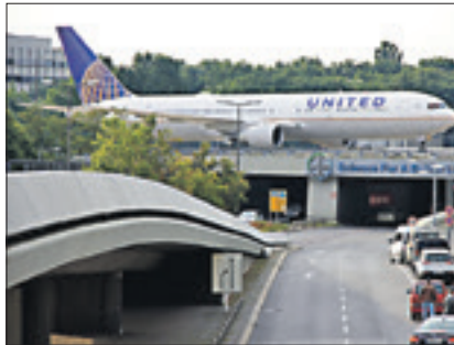
United? Was die Zukunft des Flughafens angeht, herrscht wenig Einigkeit.

Der Bund scheint das bessere Geschäft zu machen. Das 325 Hektar große Flughafengelände wird im hohen zweistelligen Millionen-Bereich taxiert. Und rund um TXL gibt es eine Reihe von Unwägbarkeiten. Nach wie vor steht der Termin für die Eröffnung des BER in den Sternen – und am 24. September steht ein von der FDP initiiertes Volksentscheid zur Offenhaltung von Tegel an. In einer kürzlich vom „Tagesspiegel“ in Auftrag gegebenen Umfrage sprachen sich 58 Prozent der Berliner dafür aus.