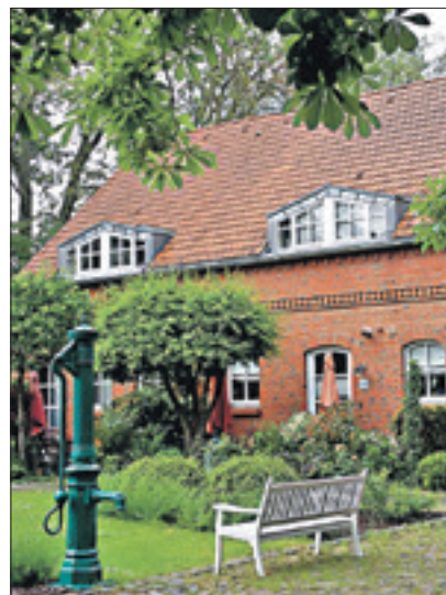
Blick auf den denkmalgeschützten Gutshof Alt-Wittenau 38

Die aus der Mitte des 19. Jahrhunderts stammende Hofanlage ist in den Jahren 1981 bis 1987 neu aufgebaut worden und bietet seither Wohnraum für über 20 Parteien. Pünktlich zur 750-Jahr-Feier der Stadt Berlin im Jahr 1987 waren die Backsteinbauten wieder errichtet worden. Im Originalzustand sind nur einige Hausgiebel; bei genauem Hinsehen heben sich die aus der Mitte des 19. Jahrhunderts stammenden Originalbacksteine deutlich ab. An der Hofmauer an der Straßenfront ist ein Bronzeschild mit dem Wappen des Fuchsbezirkes und der Inschrift „Bauherrenpreis 1992“ angebracht. Der Bezirk Reinickendorf verleiht diesen Preis seit 25 Jahren alle zwei Jahre und würdigt damit Bauherren für die