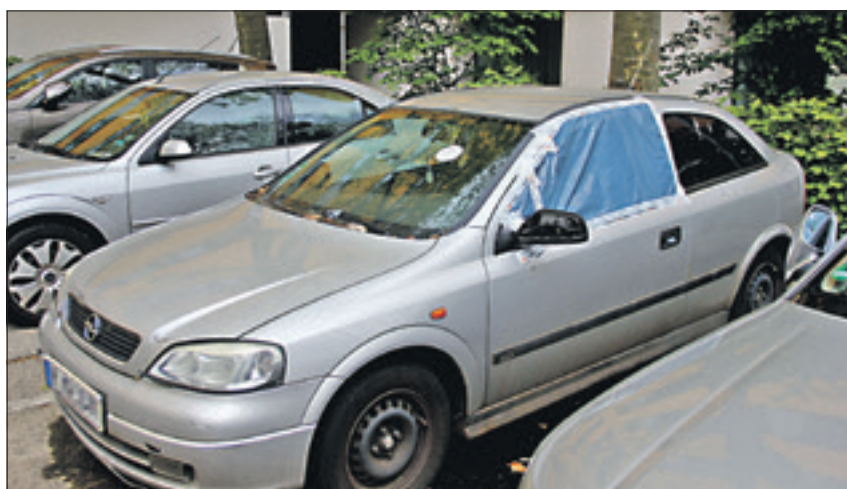
Der silberne Opel Astra fällt sofort ins Auge. Folie statt Seitenfenster, ein Aufkleber des Ordnungsamtes auf der Windschutzscheibe.

Ein silberner Opel Astra fällt sofort ins Auge. Das Seitenfenster auf der Fahrerseite ist durch eine Plastikfolie ersetzt, die „Karre“ macht einen abgegrenzten Eindruck, hat aber ein Kennzeichen mit Berliner Nummer. Auf der Windschutzscheibe hat das Ordnungsamt unter Androhung von Bußgeld einen Aufkleber mit der Aufforderung zur Beseitigung des Fahrzeugs angebracht. Wenige Meter weiter ein roter Volvo V 40, ohne Nummernschild und in keinem guten Zustand. Gegenüber ein verdrehter silberner E-Klassen-Mercedes, mit plattem linken Vorderrad und mit einem russischen Kennzeichen. Insgesamt stehen zehn Autos dieses Kalibers auf dem Parkplatz. Knapp drei Wochen später kommen wir nochmals hierher – und es hat sich nichts geändert. Die Fahrzeuge stehen nach wie vor an ihrem