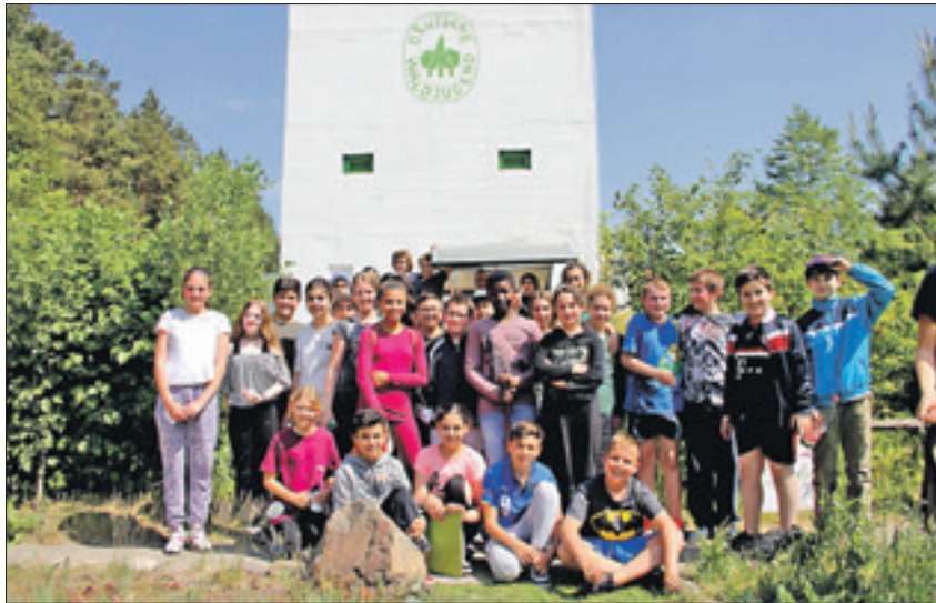
Strahlende Gesichter bei bestem Wetter am Naturschutzturm. Die Waldjugendspiele haben Spaß gemacht.

Grundschule an der Peckwisch führte Waldjugendspiele am Naturschutzturm durch