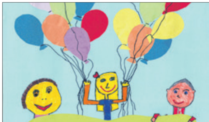
Der Ankündigungsflyer verspricht ein buntes Programm.

Die Grundschule in Glienicke/Nordbahn verwandelt sich in einen Festplatz