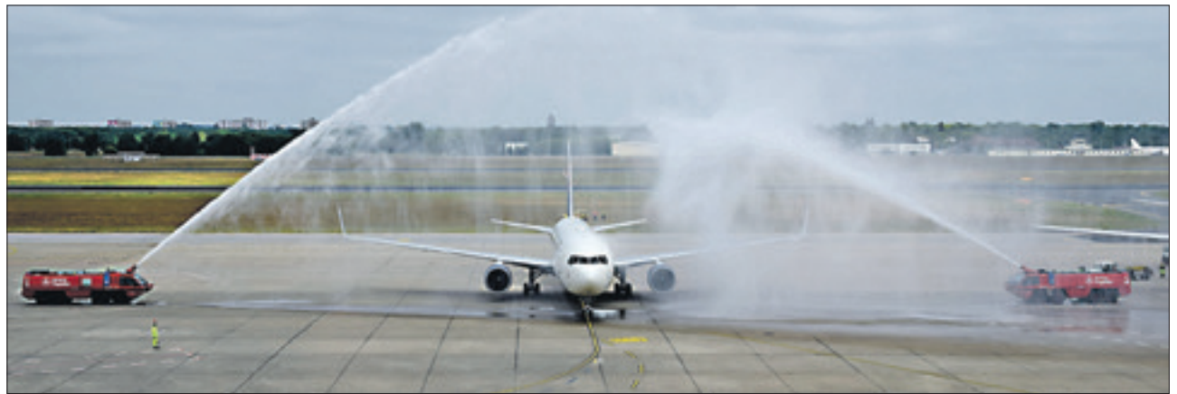
Zwei Fahrzeuge der Tegeler Flughafenfeuerwehr begrüßen den Erstflug DL222 bei seiner Ankunft auf dem „Otto Lilienthal“-Airport mit einer kräftigen Wasserfontäne.