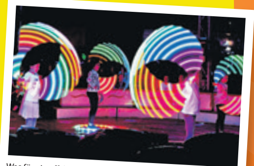
Was für ein effektvoller Auftritt mit leuchtenden Reifen!