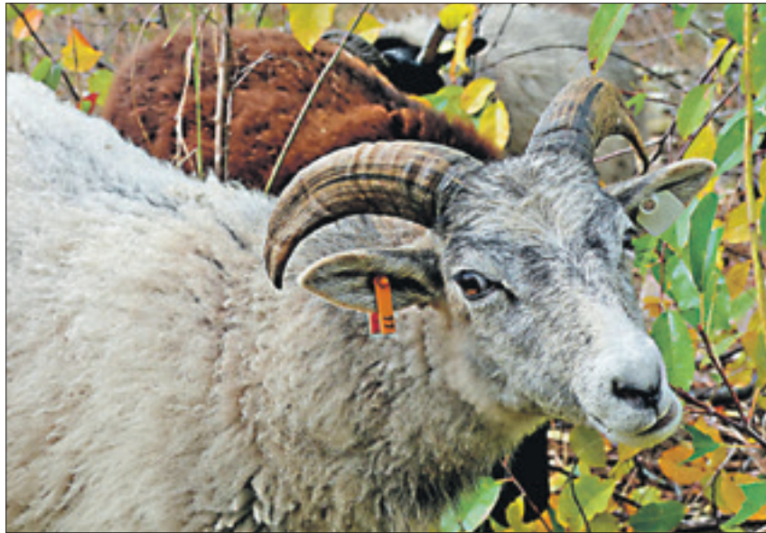
Ob dieser Vierbeiner eine Ausbildung zum Landschaftspfleger hat?

Vierbeinige Landschaftspfleger des NABU sind zurück am Flughafensee