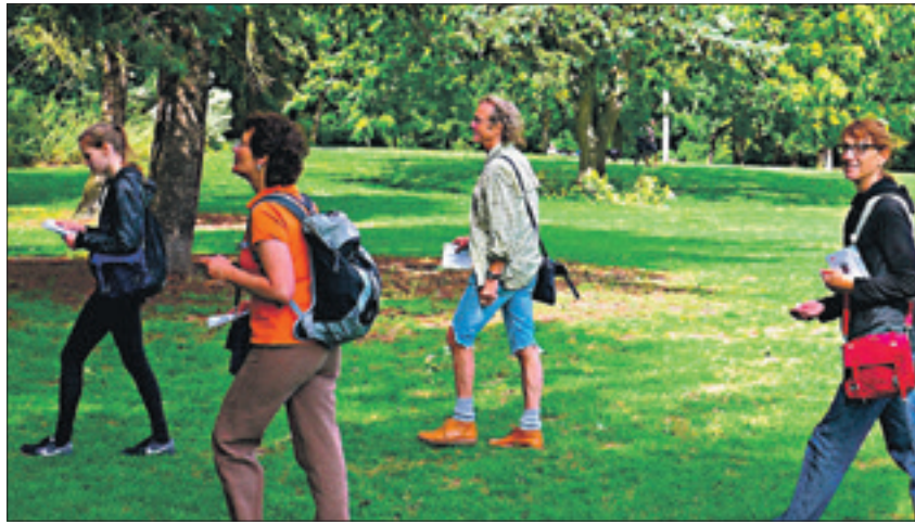
Mehr als ein Spaziergang bietet der Aktivierungs-Walk.

Volkshochschule verknüpft Bewegung und Merkfähigkeit am Tegeler See