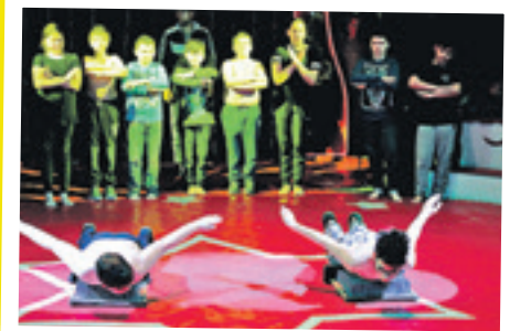
Die Fakire legten sich mutig auf eine Platte voller Nägel.

Arda: Sie fanden es sehr gut, vor allem die Tricks! Mein Vater war sehr erstaunt!