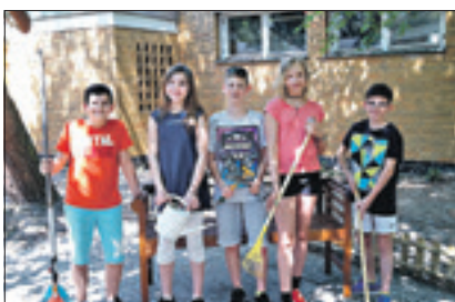
Auf der Terrasse steht nun eine von der 7c montierte Bank.

Wittenau – Unkraut wurde entfernt. In den Blumenkästen blühen nun Lavendel, Thymian und Sonnenblumen. Für den Biologie-Unterricht wurde ein Beet angelegt. Schüler der Klasse 7c des Romain-Rolland-Gymnasium haben die Terrasse vor ihren Klassenraum begrünt. Außerdem können sich die Jugendlichen nun auf einer Hängematte ausruhen. Inzwischen haben es ihnen die anderen Klassen nachgemacht und ihre Klassenzimmer-Terrassen gestaltet. Dieses besondere Projekt wurde von der Schülervertretung initiiert und stieß bei den Lehrern und der Schulleitung auf Begeisterung. red