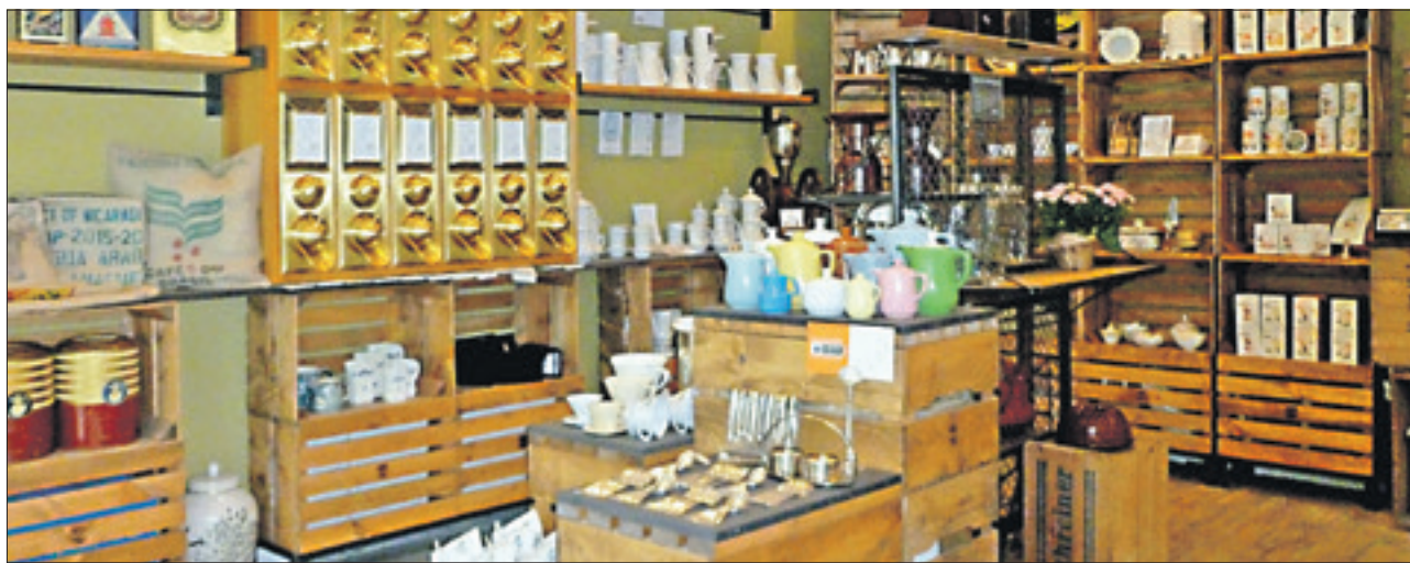
Der Laden in der Ruppiner Chaussee 289 in der Nähe vom S-Bahnhof Schulzendorf ist Geschäft, Café und Museum in einem.