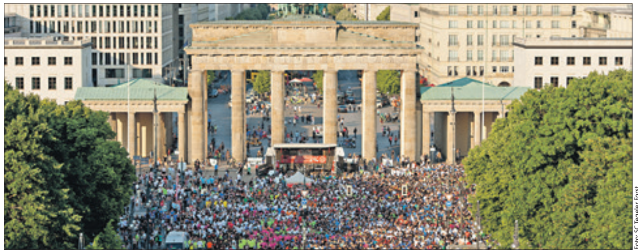
Am 21. Juni wird es wieder voll rund ums Brandenburger Tor. Mehr als 14.000 Läufer, Skater und Walker werden zum Firmenlauf erwartet.