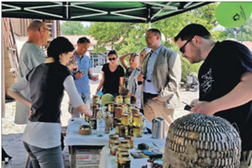
Honigverkostung beim „Tag der Offenen Imkerei“ im vergangenen Jahr

Auch die bezirklichen Imker präsentieren sich im Schul-Umwelt-Zentrum