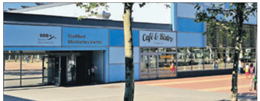
Bewohner des MV müssen auf andere Schwimmbäder ausweichen.

Das öffentliche Schwimmbad im Herzen der Trabantenstadt ist seit Ende April werktags nur bis 15 Uhr für die Reinickendorfer geöffnet und am Wochenende komplett geschlossen. Unter der Woche steht das Bad ab 15 Uhr dem Schul- und Vereinssport zur Verfügung. „Für Berufstätige und Familien bedeutet das praktisch für mehrere Monate eine komplette Schließung der Halle“, kritisiert der