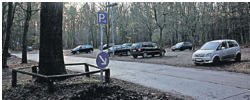
Auf dem Parkplatz am Schwarzen Weg tappt man schon länger im Dunkeln.

Konradshöhe – Kinder, die bei Dunkelheit verängstigt auf den Bus warten. Ein Parkplatz, der insbesondere im Winterhalbjahr vereist und schlammig ist und dadurch gefährlich. Dieses Bild zeichnet der Reinickendorfer Abgeordnete Stephan Schmidt in einer Pressemitteilung. Grund des Ärgernisses ist die fehlende Beleuchtung des Parkplatzes und der Bushaltestelle „Scharfenberg“, die beide am Schwarzen Weg in Konradshöhe liegen. Seit die Schulfarm Insel Scharfenberg unter Verwaltung der Senatsschulverwaltung steht, sind diese Lichter aus. Da der Parkplatz im Tegeler Forst liegt, wird nun nach der Zuständigkeit geforscht.