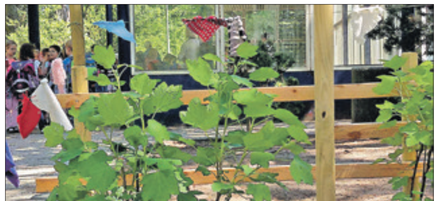
Auch die Münchhausen Grundschule in der Cité Foch hat einen Garten angelegt.